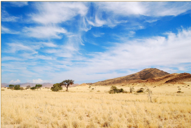
พื้นที่ทุ่งหญ้ากึ่งทะเลทราย ในประเทศนามิเบีย