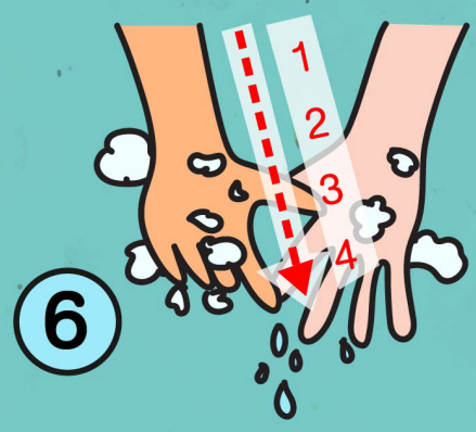
6. ถูเล็บพร้อมนับจังหวะ 1 2 3 4 จนครบทุกเล็บ