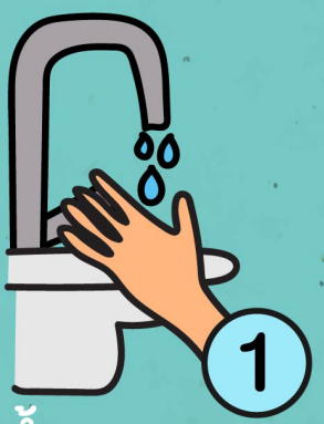
1. เปิดน้ำเบา ๆ