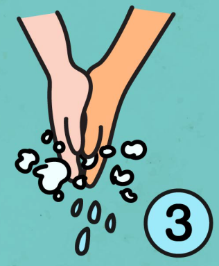
3. มือซ้าย-ขวา บรรจบกัน ปลายนิ้วมือชี้ลงพื้นถูฝ่ามือ โดยกดลากลง นับจังหวะ 1 2 3 4