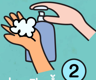
2. ใช้สบู่และปิดน้ำ