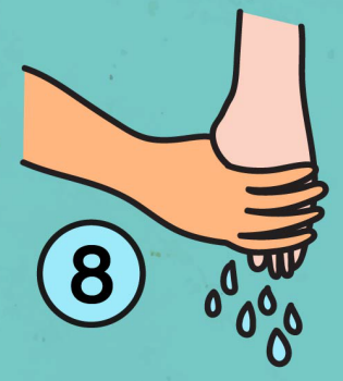
8. รูดน้ำจากมือไม่สับัดมือ เพื่อน้ำไม่กระเซ็นโดนตนเอง ผู้อื่น และผนัง