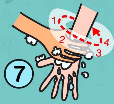
7. กำข้อมือแล้วหมุน พร้อมนับจังหวะ 1 2 3 4 ทั้งสองข้าง