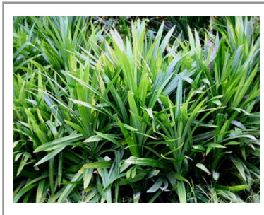
ไม้ประดับ