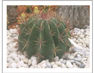
ไม้ประดับ