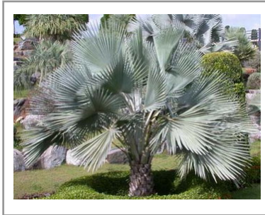
ไม้ประดับ