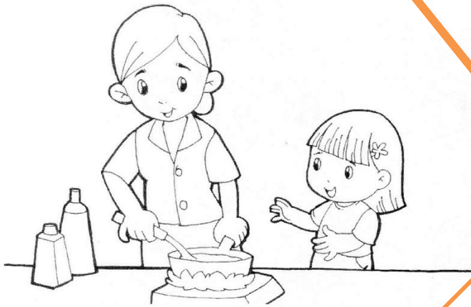
คุณแม่ทำอาหารให้รับประทาน

★ สำรวจตนเองตามความเป็นจริง แล้วระบายสีภาพกิจกรรมที่คุณแม่เคยทำให้เรา