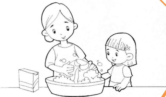
คุณแม่ซักเสื้อผ้าให้สวม