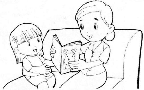
คุณแม่อ่านหนังสือให้ฟัง

12 สิงหาคม วันแม่แห่งชาติ คุณแม่เคยทำอะไรให้กับเราบ้างนะ ... หนูรักคุณแม่ค่ะ