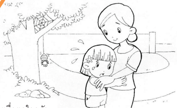
คุณแม่ปลอบเมื่อตกใจกลัว